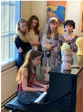
Leerlingen van het Baarnsch Lyceum

Dit jaar werd het Baarnsch Lyceum benaderd en konden wij een tentoonstelling organiseren met werk van midden- en bovenbouw leerlingen. Bijzonder was de uitleg bij de eindexamensstukken waarin leerlingen de keuze van hun werk motiveerden en de link met het maatschappelijke verantwoordden. Bij de opening van de tentoonstelling waren twee leerlingen zo moedig ons te verrassen met hun muzikale talent voor piano en zang.