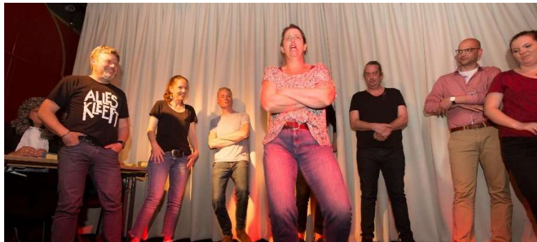
Theatersport Retourtje Vooruit tegen Andere Koek uit Deventer.

Heerlijk dat we dit jaar weer veel diverse voorstellingen konden organiseren in Artishock. De voorstellingen worden gemiddeld steeds door tussen veertig tot zestig mensen bezocht. Halverwege het jaar hebben we het programma aangepast om met lichter theater meer publiek te trekken. We eindigden met een klapper 'De Betoverende Burlesque Show'.