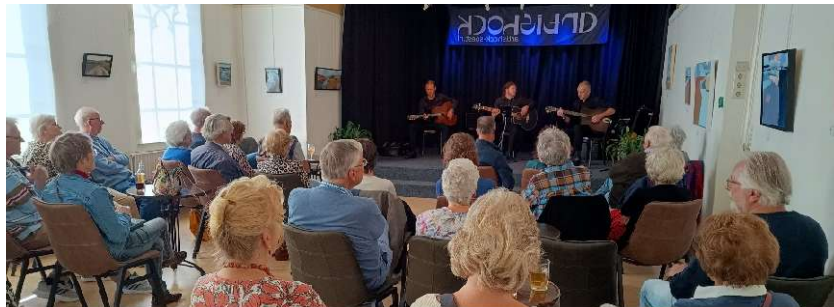
Triple Trouble Trio

September. Het werd een vliegende start. Met een virtuoos trio dat Gipsy Swing ten gehore bracht. Een uitvoering die grote be-