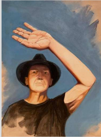
TEGENLICHT, was het thema van de januari- tentoonstelling