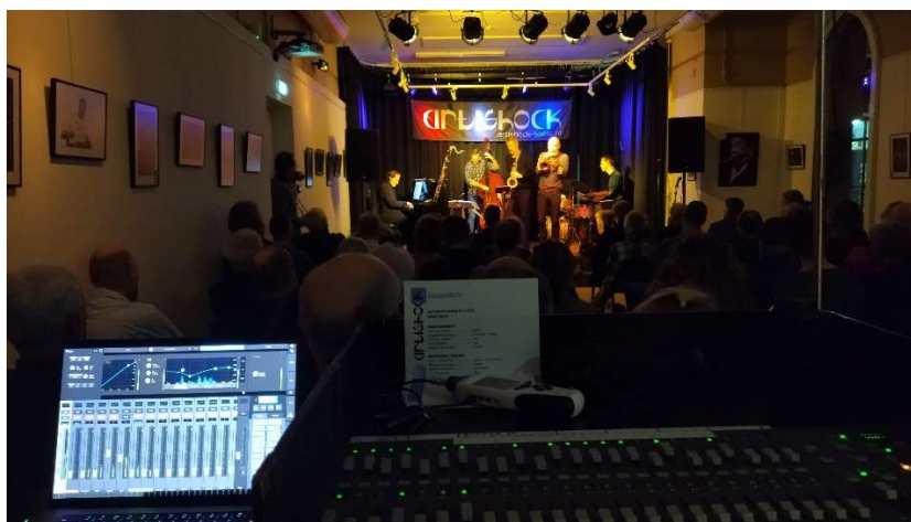
Een kijkje achter de schermen

Dit jaar heeft de werkgroep zich voornamelijk beziggehouden met de normale activiteiten, zoals technische ondersteuning inzake licht en geluid bij evenementen, onderhoud en reparatie.