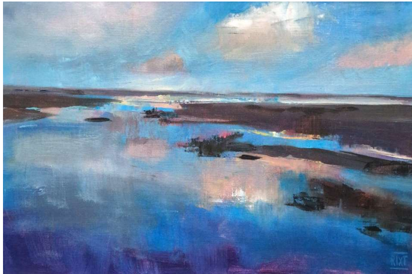
Werk van Rixt Wagter-Siebinga

Na een zomerstop in de maanden juli en augustus kreeg tekenclublid Rixt Wagter-Siebinga het podium met haar kleine juweeltjes: ‘Geen grote verhalen, maar kleine momenten die het waard zijn om te zien’ .