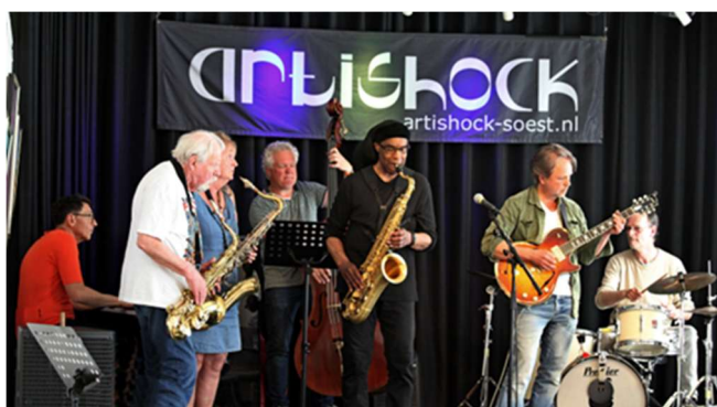
Jazz- Jam