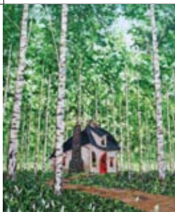
10 Anne Belleforte F.C. Kuijperstraat 11