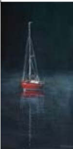
28 Hetty Uyland Schoutenkampweg 43