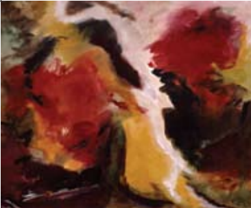
26 Elsje Hofman Braamweg 97