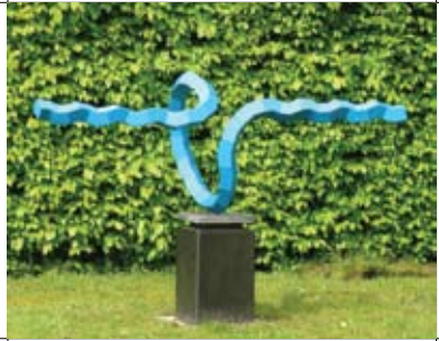
30 Beeldentuin en Galerie Pimpelmees 3 HazArt kunststichting