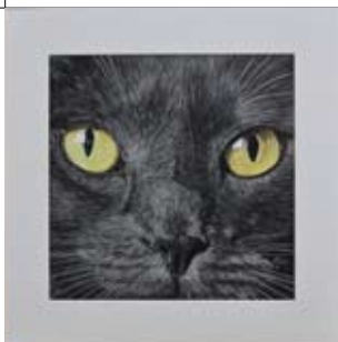
24 Anja van Gardingen Birkstraat 96 Boerderij Vosseveld (10.00 – 16.00 u.)