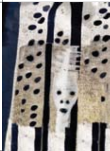
2b Jeannet Kool Klarinet 39 De Vijverhof (grote zaal) alleen zondag (11.00 – 18.00 u.)