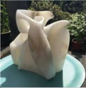
17 Alma Visser Middelwijkstraat 60