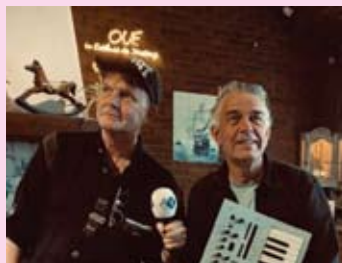
Palescue en Funckler