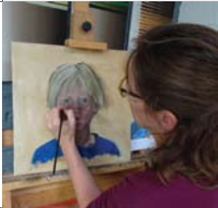
6 Ombers & Okers Nijverheidsweg 20