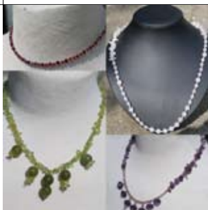
22 Nelleke Nieuwboer Bilderdijklaan 41