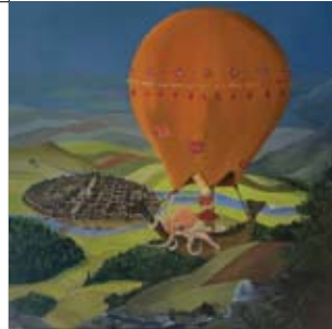
27 Jacqueline Bouricius Schoutenkampweg 73