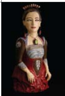
3 Nadjezda van Ittersum Citer 39