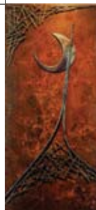
12 Ruud Termijn Van Weedestraat 97 't LOU-vre ROOFTOP