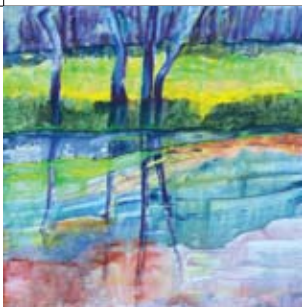
9 Anita I Nap Inspecteur Schreuderlaan 100 via hoofdingang