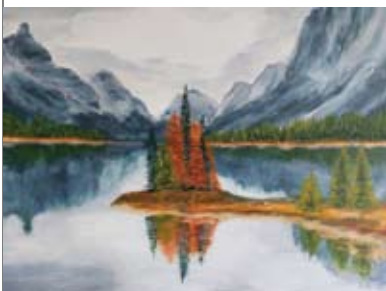
4 Margriet de Haan Clemensstraat 64