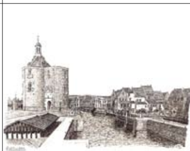
24 Gerard Kuit Birkstraat 96 Boerderij Vosseveld (10.00 – 16.00 u.)