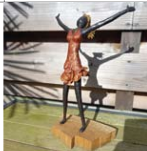
28 Maaike Schut Schoutenkampweg 43