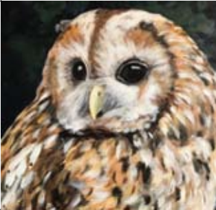
18 Bobette t.o. Ferdinand Huycklaan 3