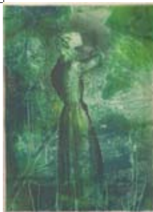
8 Karen Pompe Heuvelweg 13