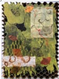
21 Margreet Dijkstra Veldweg 1