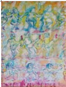
20 Ineke Talen Kerkstraat 28A (ingang aan de Veldweg)