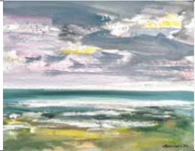
31 Reinier Kamphuis Eigendomweg 17