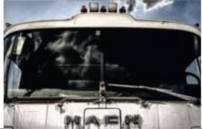
26 Meino de Graaf Braamweg 97