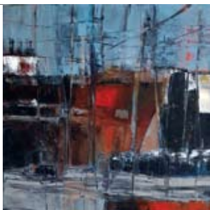
11 Elies Auer Kerkpad NZ 21 alleen zaterdag