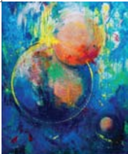
12 José Marcus Van Weedestraat 97 't LOU-vre ROOFTOP