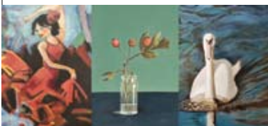
5 Schildercursisten Wiarda Beckmanstraat 475 Honsbergen alleen zaterdag