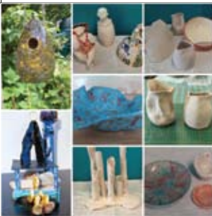
32 Werkplaats Boetseren Smitsweg 311 De Plantage