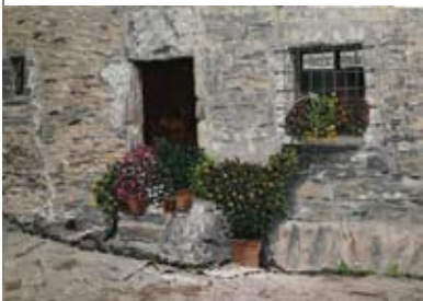
2b Chantal Loman Klarinet 39 De Vijverhof (grote zaal) alleen zondag (11.00 – 18.00 u.)