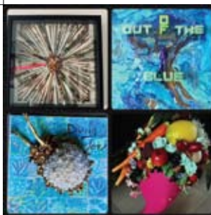
23 Eveliene Schut Birkstraat 107 Boerderij Het Gagelgat alleen zondag (10.00 – 16.00 u.)