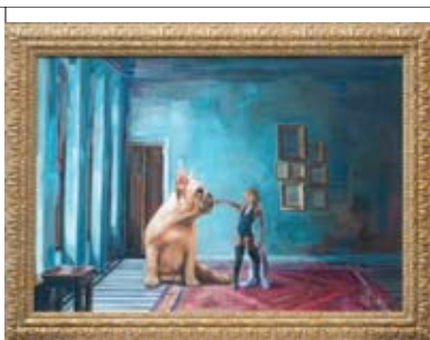
12 Haike Bes Van Weedestraat 97 ‘t LOU-vre ROOFTOP