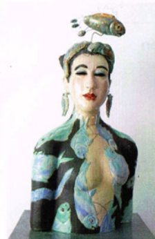
Tsarina's kijken je uitdagend aan

De Tsarina's kijken de bezoeker uitdagend aan van onder hun ludieke hoofdtoelen, waarin vaak vissen, bloemen en vlinders zijn verwerkt. De beelden zijn geglaazuurd in harmonieuze tinten. Hierna wordt goud en zilver luster aan de tooien toegevoegd; verfijnd artistiek.