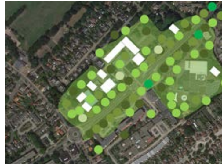
Gebouwen en plekken zijn te gast in het groen.