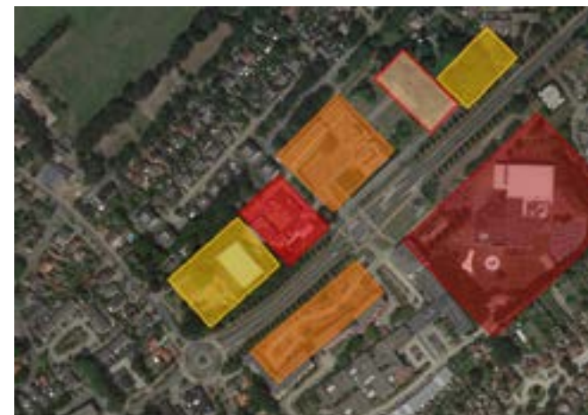
Zonder visie: mogelijk worden alle kavels en opties vol gebouwd en het karakter van Soest aangetast