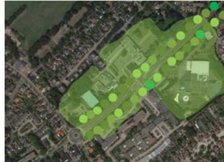
Vanuit de ruggengraat stroomt groen het plangebied in.