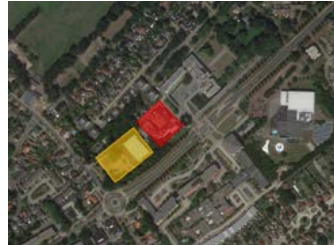
Zonder visie: losse ontwikkeling van kavels