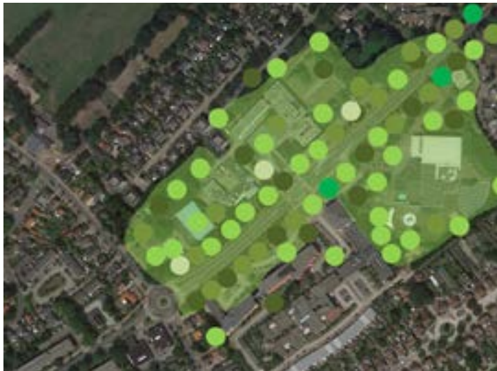
Het gehele plangebied heeft landschappelijk karakter.