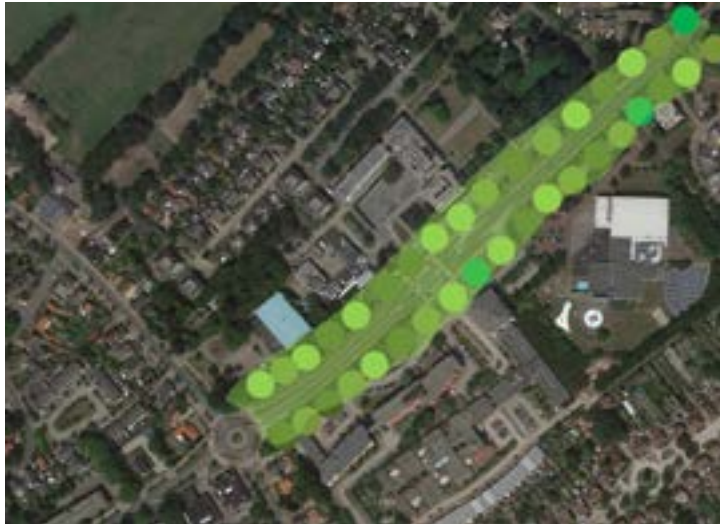
De Dalweg: de ruggengraat.