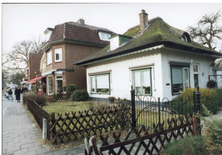
Villa Zeldenrust, Burg. Grothestraat 2, gesloopt in 1997