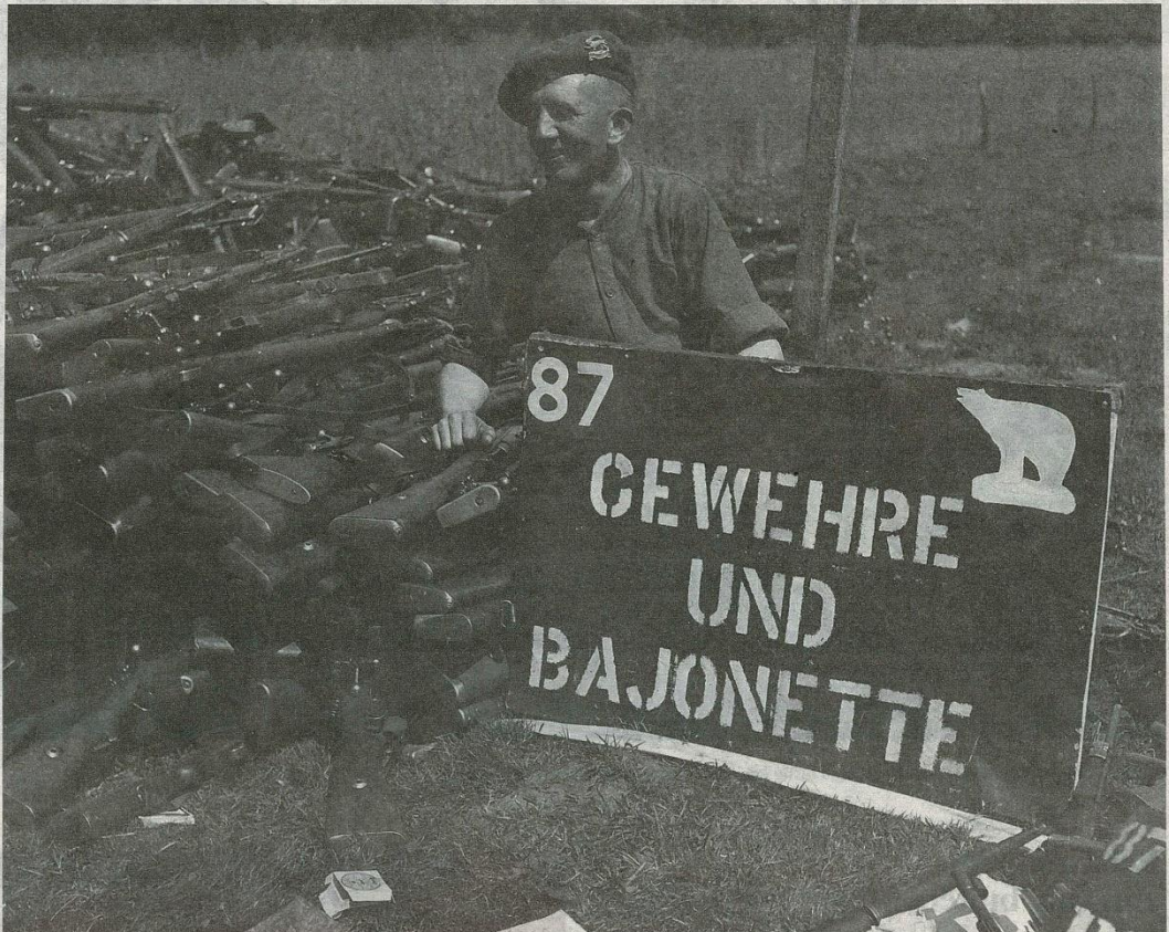
Duitse soldaten moesten hun wapens na de bevrijding inleveren bij de Polar Bears naast paleis Soestdijk. Op 10 mei 1945 ging dit gruwelijk mis.

Hij diende op 10 mei vorig jaar een verzoek in bij de gemeente Soest. Lange tijd hoorde hij niets, tot er in februari dit jaar opeens toch een reactie kwam. Zijn voorstel werd goedgekeurd. Sindsdien vullen zijn dagen zich met het maken van een lijst van genodigden voor het onthullingsmoment.