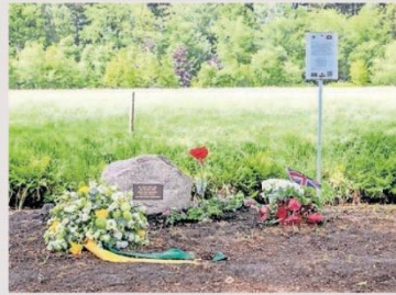
▲ De gedenksteen in Soest.

Het gaat om soldaten van het Britse 49 (West Riding) Infanterie Divisie. Hun bijnaam is de Polar Bears en de divisie was betrokken bij de bevrijding van veel gemeenten in dit deel van het land. Op 7 mei werden naast Soest ook Baarn en Hilversum door de Polar Bears bevrijd van het gewelddadige juk van de Duitse bezetter.