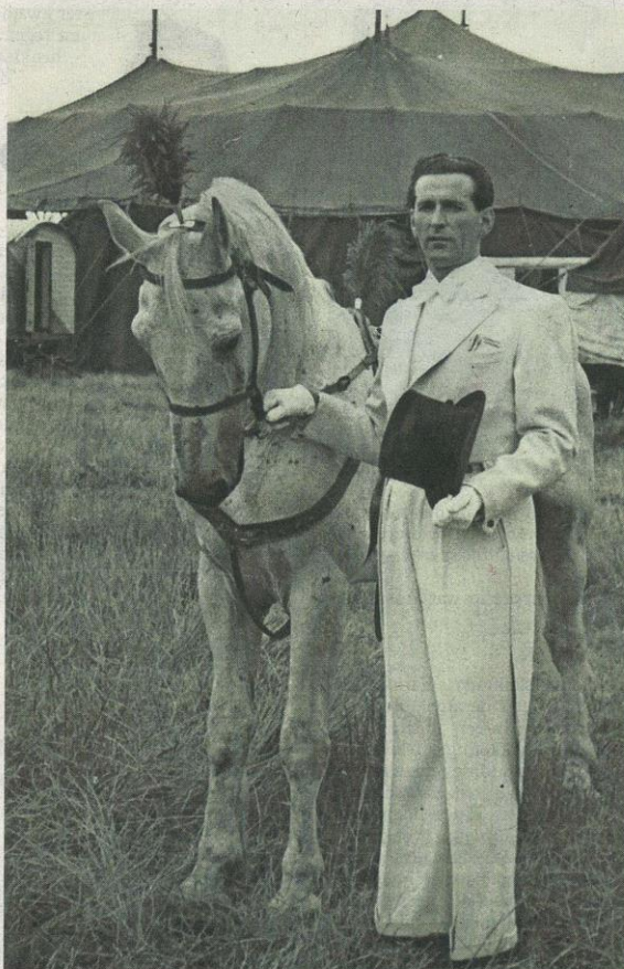
Boltini in 1954.