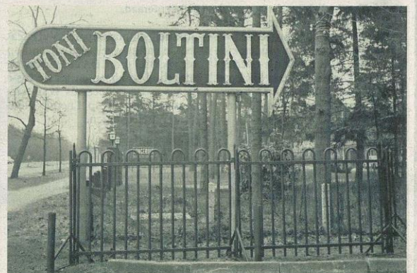
De winterstalling in Soesterberg.