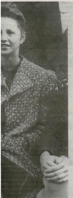
Examenklas 1941/1942 van de HBS A op het ATIECENTRUM VOOR HET NEDERLANDS PROTESTANTISME