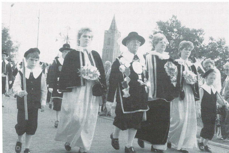
Deelnemers Brabantse Gildedag trekken langs de Oude Kerk Landjuweel 1987

Wanneer er een dergelijk groot evenement wordt georganiseerd is het noodzaak om ook te letten op de financiële middelen. De organisatie van evenementen kost geld en er staan in de meeste gevallen niet in gelijke mate ontvangsten tegenover. Het comité ging er dan ook op uit op sponsorgelden te regelen. Veel bedrijven werden benaderd, waarbij een groot aantal bereid was om een financiële bijdrage te leveren. Sommigen namen zelfs een programmaonderdeel voor hun rekening. Daarnaast werden ook andere bronnen gezocht om financiële middelen te verwerven. Zo werden verschillende promotieartikelen aangeschaft als shirts, vlaggetjes, petjes. Maar ook flessen met een landjuweellabel, speciale landjuweelmenu's bij de Soester horeca, landjuweelmunten. Zo werden toch grote bedragen bij elkaar vergaard. Door het jaar heen werden verschillende momenten aangegrepen om die zaken ook te presenteren. Dat was dan tegelijkertijd een mogelijkheid om informatie in de pers te krijgen en de Soester bevolking te interesseren. De gemeente stelde zich uiteindelijk zeer schoorvoetend ook garant voor een deel van de kosten. Op die garantie heeft de organisatie naderhand nooit aanspraken hoeven maken, alhoewel na afloop geconstateerd kon worden dat het landjuweel de organisatie geen winst heeft opgeleverd.