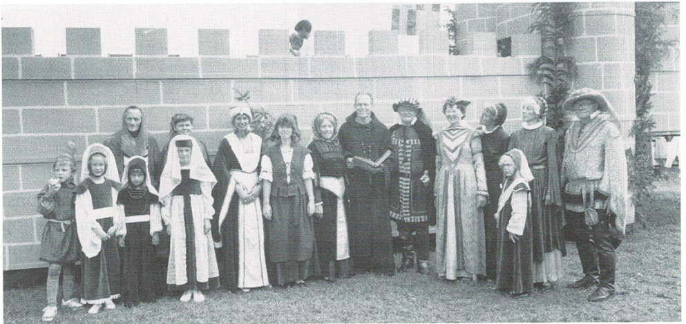
Gildevertegenwoordiging Historische Optocht Landjuweel 1987

Het landjuweel heeft heel wat losgemaakt in Soest. Ook op andere plekken dan De Blaak werden activiteiten georganiseerd zoals bij C3 en Artishock. Zoals al geschreven de buurt was versierd, en de restaurants hadden speciale menu's. Het gilde en de door haar jaarlijkse georganiseerde gildefeesten worden vanaf die tijd ook met wat andere ogen bekeken. Wat echter heel centraal staat is toch wel de grote variëteit die er aan verenigingsactiviteiten in Soest georganiseerd kunnen worden en de saamhorigheid die de organisatie van zo'n feest met zich meebrengt. Krantenknipsels te over. Een fotoboek dat speciaal over de activiteiten is uitgegeven geeft een beeld van dit imposante feest. Een feest dat eigenlijk zonder enige aanleiding werd georganiseerd. Vele honderden hebben zich ingespannen om er een geslaagd evenement van te maken. En zoals altijd de voorpret is vaak net zo belangrijk als de activiteit zelf.