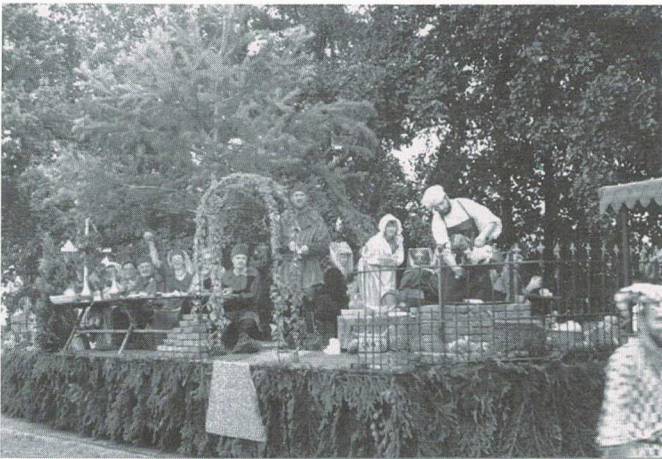
Historische optocht Landjuweel 1987

Vanaf dat moment werd er hard gewerkt om verenigingen en andere personen te stimuleren actief te worden. Bovendien moest er natuurlijk ook gewerkt worden aan een gezonde begroting. En wat eigenlijk al snel bleek was dat het begon te leven in Soest. Vele verenigingen namen zelf initiatieven om zich tijdens het Landjuweel te gaan presenteren. Zo nam de Historische Vereniging Soest het initiatief voor de organisatie van een Historische Optocht, de Soester Boerendansgroep wilde wel een Internationaal Folkloristisch Dansfestival organiseren. Er kwam een korenavond. Ook de gemeente Soest liet zich niet onbetuigd. De toenmalige burgemeester Paul Scholten was nauw betrokken bij de voortgang en voor het gilde was dat het eerste moment dat er een gestructureerd overleg met de gemeente Soest ontstond. Het feest stond in de steigers. Alleen aan de poten werd af en toe nog wel eens gezaagd. Was zo'n feest nou wel nodig? Het gilde was ontoegankelijk voor velen in Soest en de activiteiten werden als heidens ervaren. Dit soort ontwikkelingen stimuleerden de organisatoren juist om door te gaan en te zorgen voor een goede profilering.