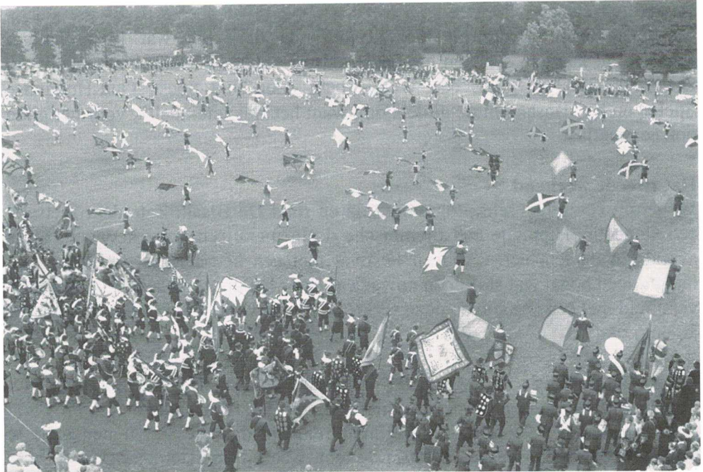
Massale opmars honderd gilden tijdens Brabantse Gildedag Landjuweel 1987

Honderden gildebroeders en gildezusters waren in alle vroegte naar Soest gekomen om deel te nemen aan de Eucharistieviering met als hoofdcelebrant Kardinaal Simonis. Nadat ieder aan de koffietafel was verrast op een uitgebreide maaltijd en de Erewijn door het gemeentebestuur werd aangeboden, trok een bonte stoet van bijna 100 gilden door een deel van Soest. Indrukwekkend was de Massale Opmars die op het gildeterrein na afloop van deze optocht en de presentatie aan de genodigden plaats vond. Zo'n drieduizend gildeleden in hun mooie uniformen en kostuums trokken De Blaak over onder luid tromgeroffel. Daarna een grote variëteit aan wedstrijden op het grote terrein: trommen, bazuinblazen, geweschieten, boogschieten en vendelen. Dan is na 22 dagen het landjuweel weer ten einde.