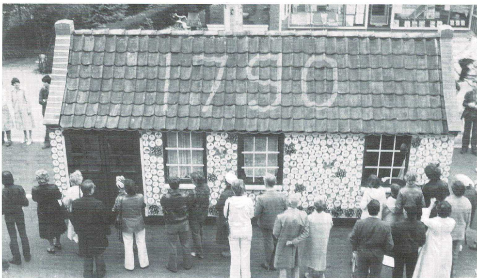
Het spreukenhuisje tijdens de Historische Optocht 1987