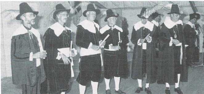
Het College van B&W in middeleeuws ornaat tijdens het Landjuweel 1987

Zeker de initiatiefnemers hebben niet kunnen voorzien welke impact hun idee zou hebben. Een feest vieren b.g.v. een jubileum daar krijg je de handen nog wel voor op elkaar. Een feest opzetten omdat het gilde een grote Gildedag wil organiseren daar is wat meer voor nodig. Wat volgens mij bijzonder was voor Soest, was het grote enthousiasme waarmee uiteindelijk door een groot aantal Soester verenigingen en organisaties is meegedaan. Dat enthousiasme leidde zelfs tot aanpassingen en dan met name aanvullingen in het programma tot soms één dag voor de uitvoering ervan. In deze bijdrage wil ik terugkijken op de vele ervaringen bij de voorbereiding, maar meer nog wil ik na 17 jaar eens terugkijken op een activiteit die bij een beperkte groep van mensen wel heel veel energie heeft gekost. Want in de voorbereidingstijd moesten nogal wat tegenslagen worden overwonnen.