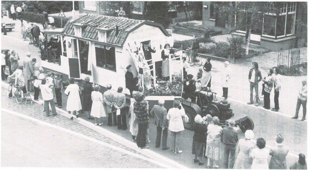
Gilde-teerdag in de Gouden Ploeg tijdens de Historische Optocht 1987