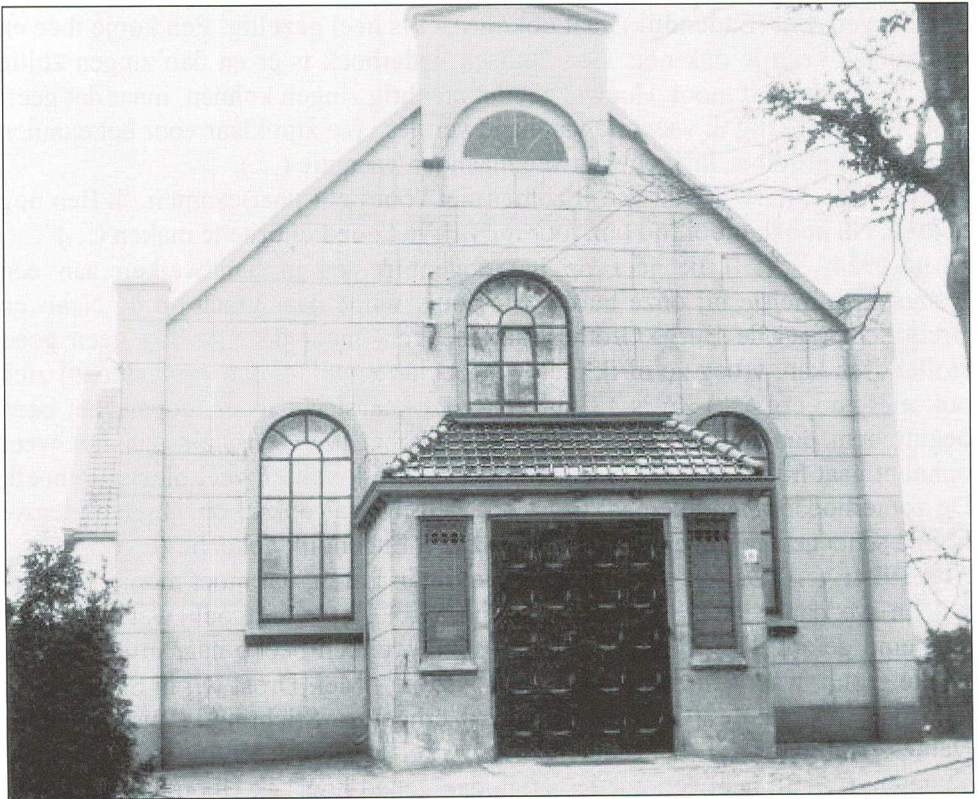
De Wilhelminakerk aan de Julianalaan is gebouwd in 1909. Hier zien we de voorzijde in de oorspronkelijke situatie. In 1924 wordt de kerk drastisch verbouwd.