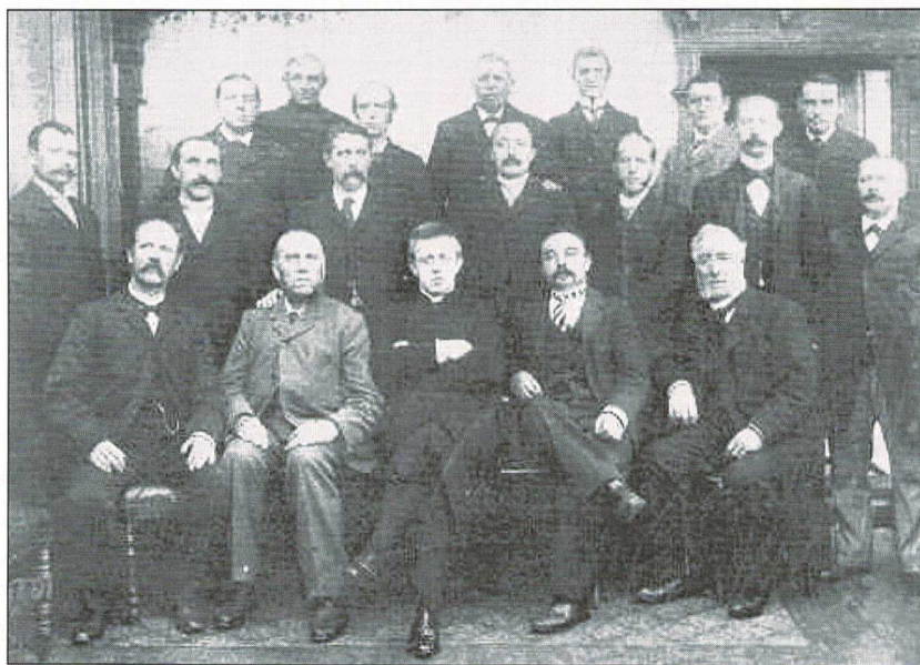
Het rooms-katholiek zangkoor "Sint Cecilia"(1904) 4

De accordeonvereniging Animato is op 1 april 1955 opgericht en viert dit jaar haar vijftig jarig bestaan. Het is maar een willekeurige greep. Van het rooms-katholiek zangkoor "Sint Cecilia" is een foto uit 1904 beschikbaar, nu meer dan een eeuw terug.