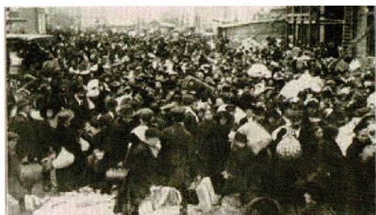
Über 400 000 belgische Flüchtlinge zogen nach dem Fall Antwerpens nach Holland.

In Antwerpen was een pontonbrug over de Schelde aangelegd. De overhaaste vlucht leidde tot chaotische toestanden bij de toegang tot de brug.