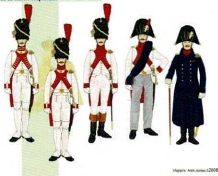
L'officier des Grenadiers Hollandais de la Garde Impériale.