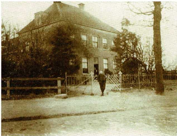
Openbare lagere school in de Kerkebuurt Soest 1914