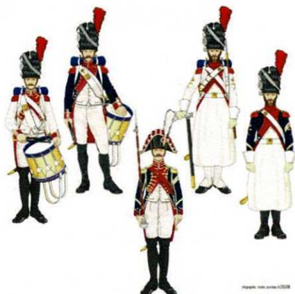
Tambour Grenadier Hollandais, bron: André Jouineau.