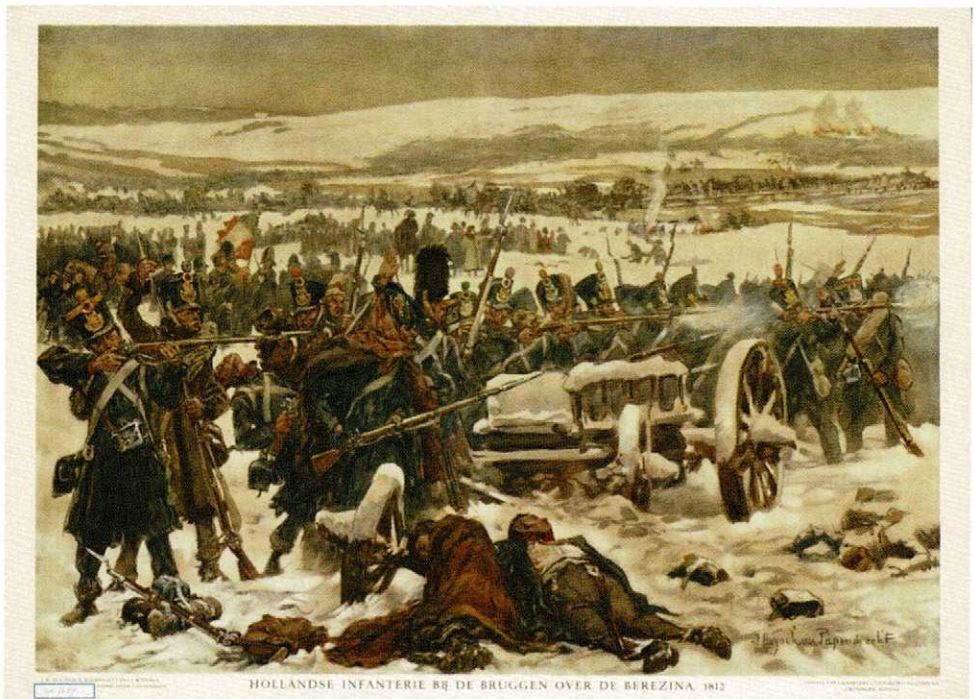
Hollandse Infanterie bij Berezina, 1812

van verschillende nationaliteiten. Naast Fransen (50% bij infanterie, 35% bij de cavalerie) waren ook Italianen, Polen, Pruisen, Zwitsers, Nederlanders, Duitsers en Spanjaarden vertegenwoordigd. Het leger werd: “La Grande Armée” genoemd. De meeste grenadiers kwamen om tijdens de Veldtocht naar Rusland: alleen al de zware tocht richting Moskou kostte zo’n 40% het leven. De Fransen kunnen uiteindelijk pas op 14 september Moskou binnentrekken. Nog diezelfde dag breekt in de stad een brand uit (vermoedelijk aangestoken door de Russen), die Moskou voor driekwart in de as legt. Omdat het hierdoor onmogelijk wordt zijn manschappen nog langer voedsel en onderdak te bieden, is Napoleon in oktober genoodzaakt zich terug te trekken naar het westen. De timing is slecht. De winter treedt in Rusland al snel in en daar is het leger totaal niet op voorbereid. Het overgrote deel van de manschappen bestaat uit voetsoldaten. De barre kou, in combinatie met enkele Russische aanvallen, zorgen voor enorme verliezen aan de kant van het Napoleontische leger. Het Franse leger arriveerde op 9 november