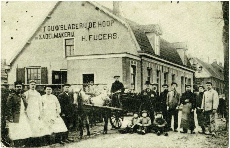
Belgische vluchtelingen doen vrijwillig werk voor Soester bedrijven; hier een groep bij touwslagerij Fugers in de Eemstraat.

Het was vanzelfsprekend een gigantische organisatie om de Belgen op te vangen en onderdak te verschaffen. In Soest werd daarvoor in hoofdzaak een beroep gedaan op particulieren, al was hier en daar (St. Josephgesticht, Trein 8.28, openbare school in de Kerkebuurt) ook wel plaats voor kleine groepen. Niet minder omvangrijk waren