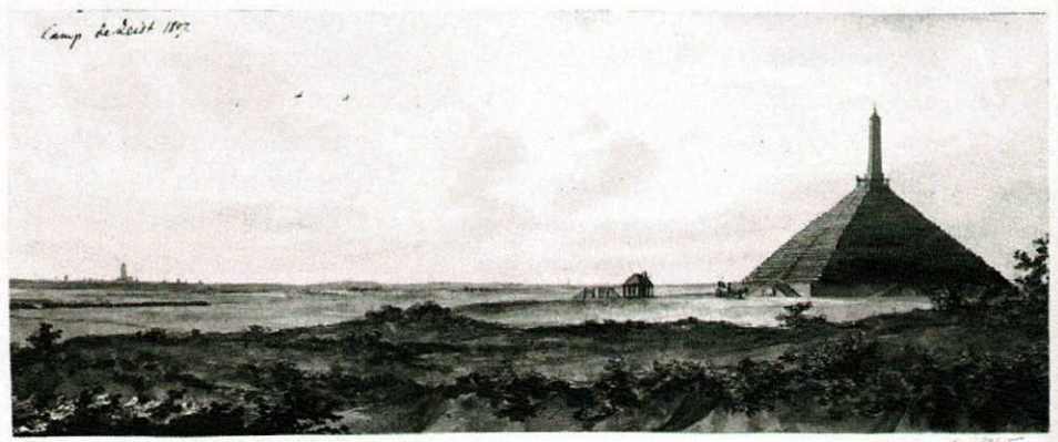
Pyramide van Austerlitz Camp de Zeist, 1807, bron: Geheugen van Zeist.

naar Amersfoort. Even buiten de stad maakte hij een korte stop om de paarden te verwisselen. In Amersfoort werd hij in de loop van de middag opgewacht door de burgemeester en wethouders. Zij verwelkomden de keizer en boden hem de vergulde sleutels van de stad aan op een groen fluwelen kussen. Mogelijk dat Napoleon uit zijn koets is gestapt om de erbewijzen van de hoogwaardigheidsbekleders te aanvaarden, maar