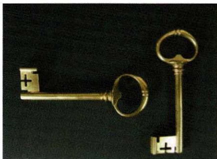
Twee verguld koperen sleutels der stad Amersfoort op fluwelen kussen, bron: Flehite.

de sleutels nam hij niet mee. Napoleon had haast en wilde snel verder. Keizer Napoleon was in Amersfoort slechts een passant en liet zijn stadsleutels in Amersfoort achter in handen van het verbouweweerde stadsbestuur. De bestuurders namen ze teleurgesteld mee terug naar het stadhuis en stopten ze in een kast. Daar werden ze in de loop van de 19de eeuw 'tusschen oude papieren' teruggevonden. Tegenwoordig liggen ze in Museum Flehite.