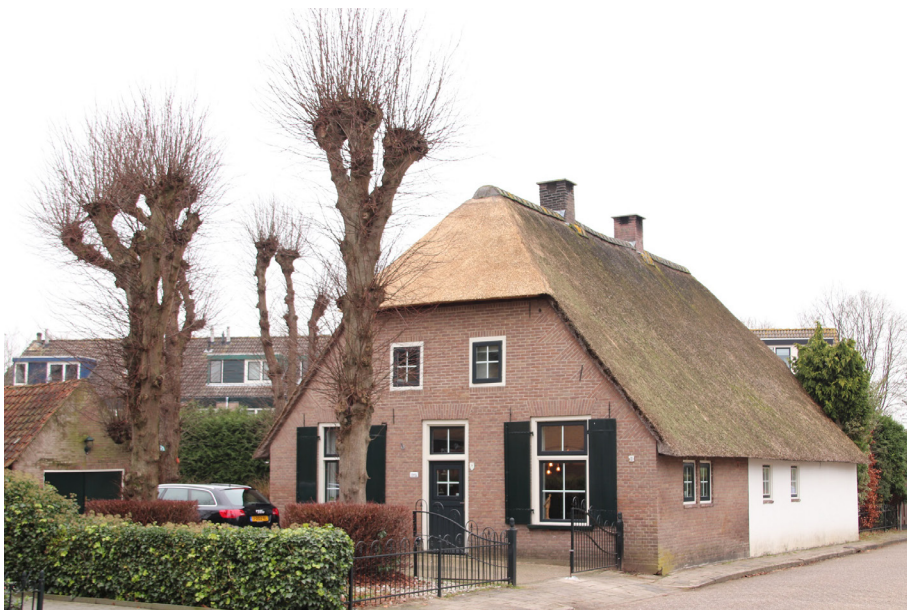
Langhuisboerderij Ouders Vrucht 202