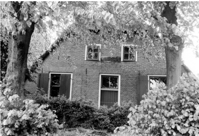
Ouders vrucht 1989

Deze keer aandacht voor een pand uit Soesterberg dat staat aan de Van der Griendlaan 11 (vroeger Oude Postweg). Het is het oudste gebouw dat Soesterberg rijk is en zou gebouwd zijn begin 1800.