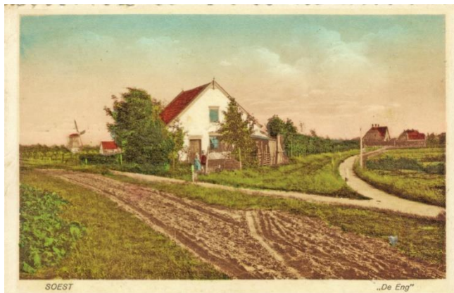
Prentbriefkaart uit 1924 met de daggelderswoning