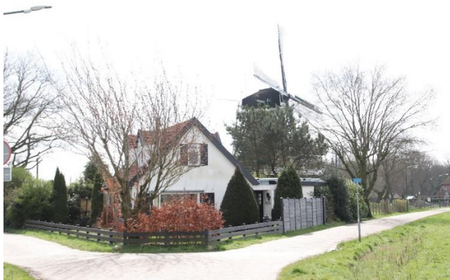
Molenweg 28 anno 2024