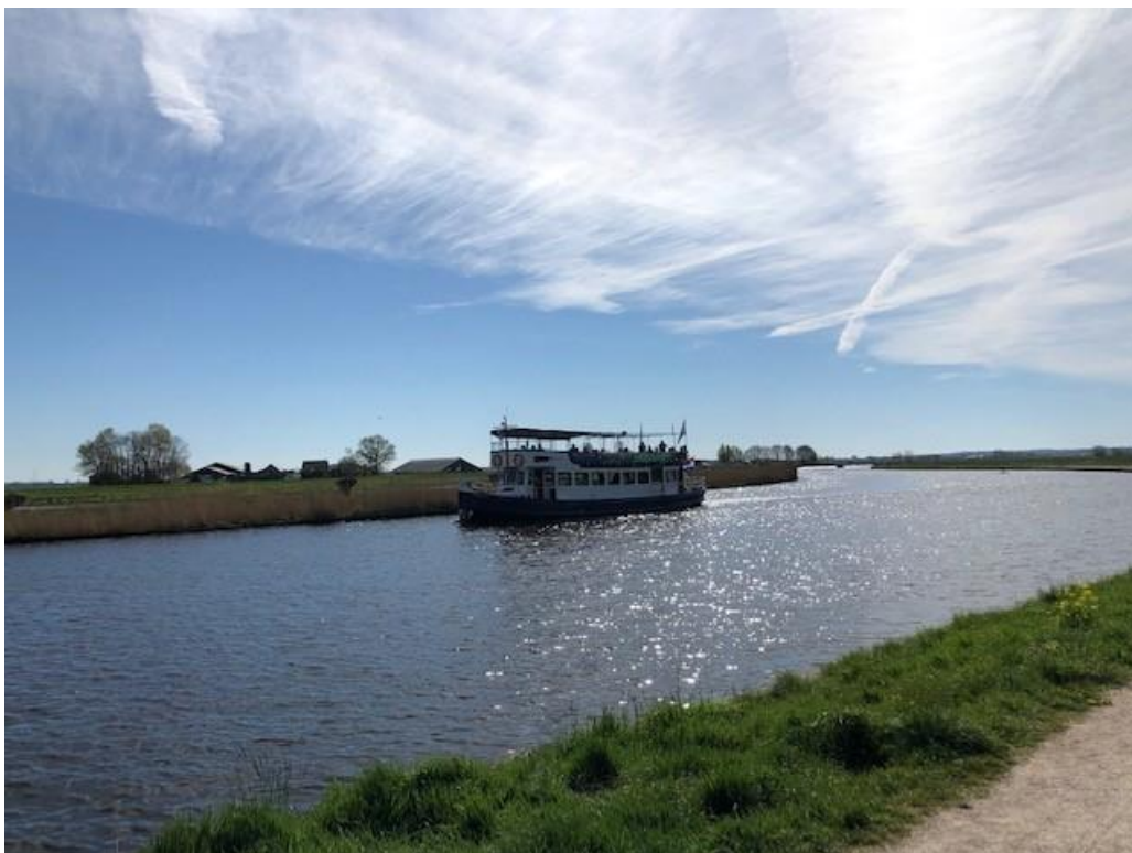
Fietsboot op de Eem bij Baarn

Wanneer u de puzzel heeft gemaakt kunt u de oplossing mailen naar Practiviteiten@pitbaarn.nl of op een kaartje schrijven, met vermelding van uw naam, adres en telefoonnummer en inleveren bij de receptie van De Leuning. Uit de inzenders met de juiste oplossing wordt een winnaar getrokken en deze krijgt een gratis kopje koffie / thee aangeboden bij een volgend bezoek aan De Leuning. Veel succes en plezier!