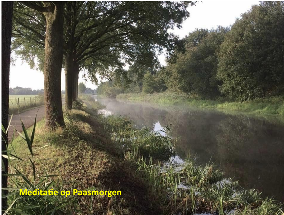
Meditatie op Paasmorgen

Het zal in alle vroegte zijn als toen. De steen is weggerold. Ik ben uit de grond opgestaan. Mijn ogen kunnen het licht verdragen. Ik loop en struikel niet. Ik spreek en versta mijzelf. Mensen komen mij tegemoet - wij zijn in bekenden veranderd.