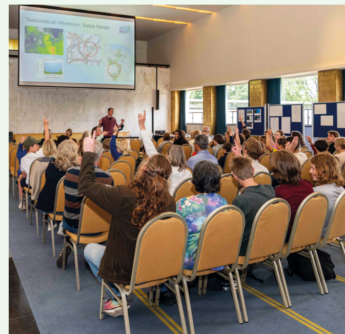
Toekomstlab Hilversum voor het voortgezet onderwijs