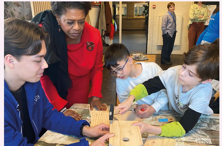
Toolkit klimaatproof schoolplein