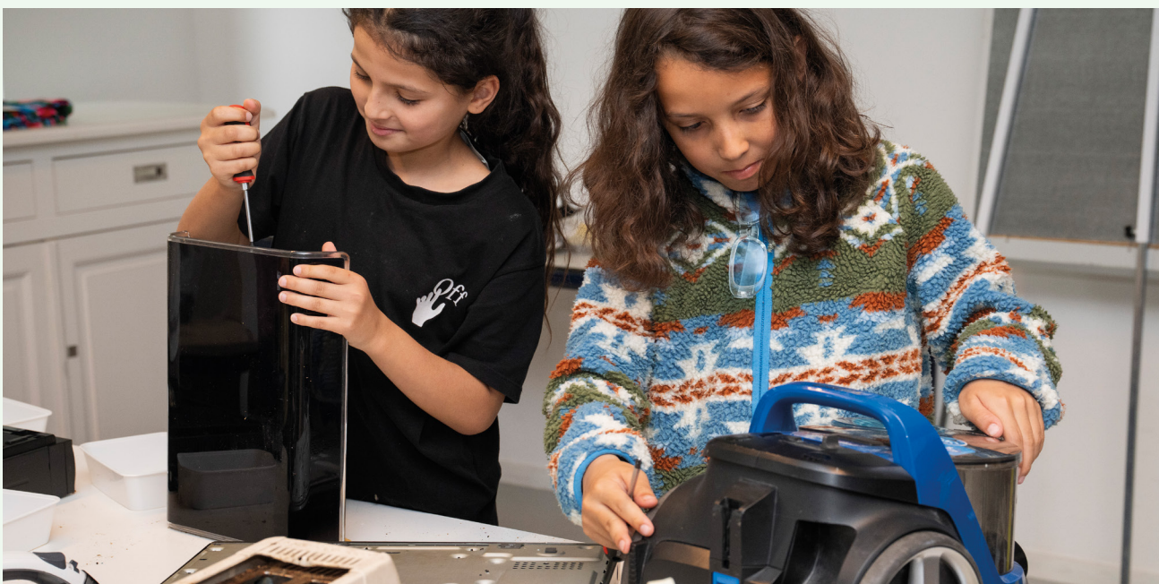
Ontdek, leer en repareer (De Kindercampus)