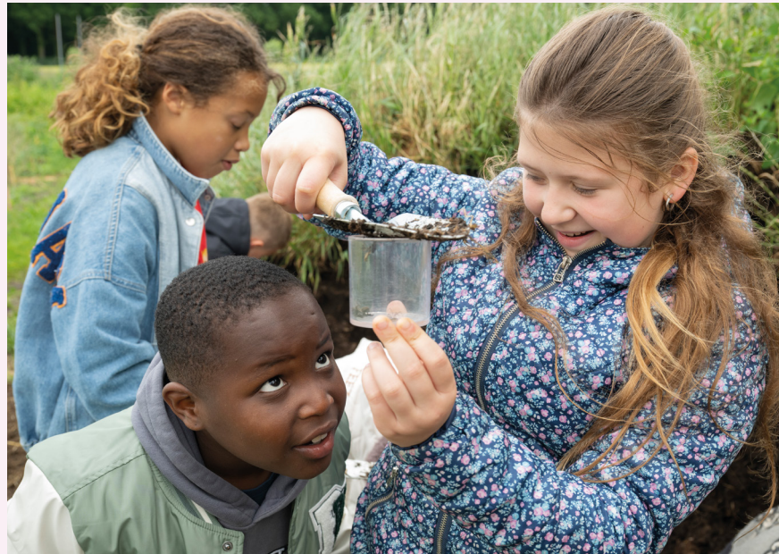
Aap en Mol op avontuur