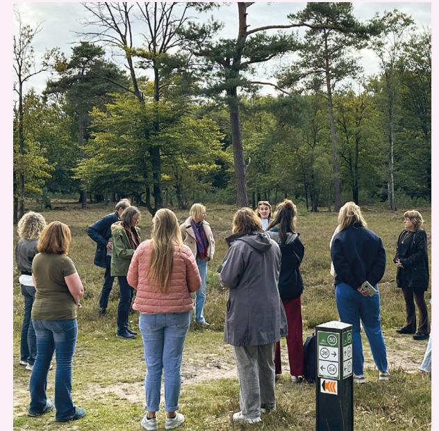
Inspiratiemiddag voor leerkrachten