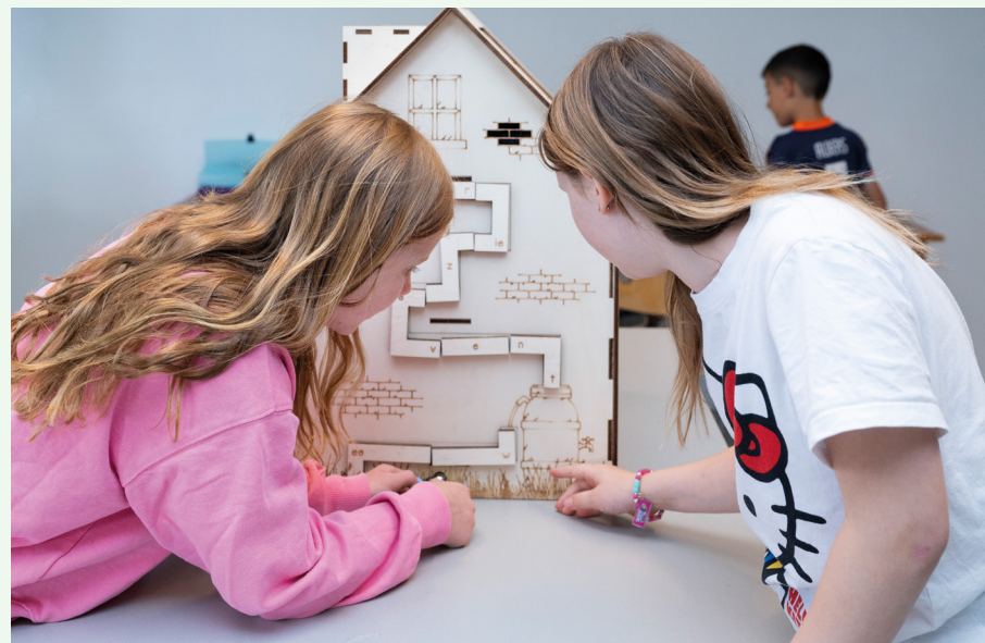
Escapegame het Duurzame Huis (Basisschool De Wilge)