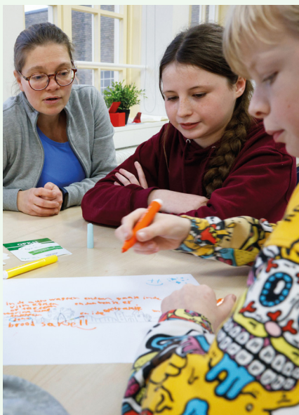
GAD-lesprogramma 'Afval, less is more' (Nassauschool)