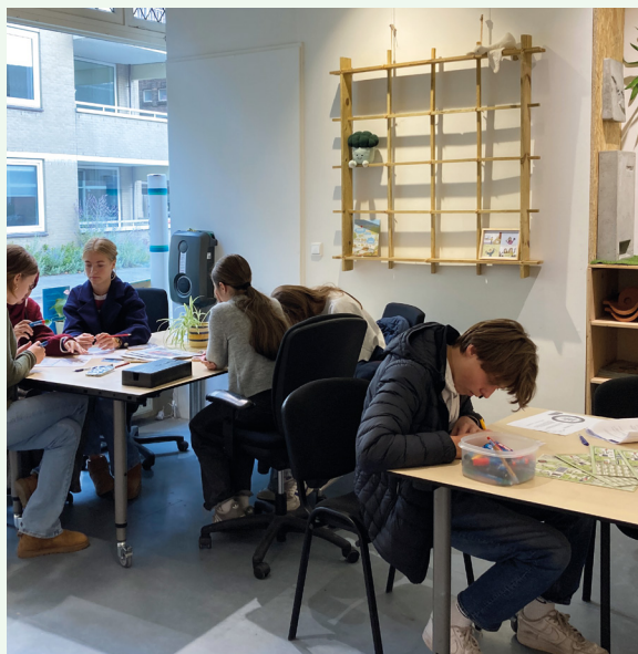
Brainstorm in het duurzaamheidscentrum Hilversum (SG Laar en Berg)