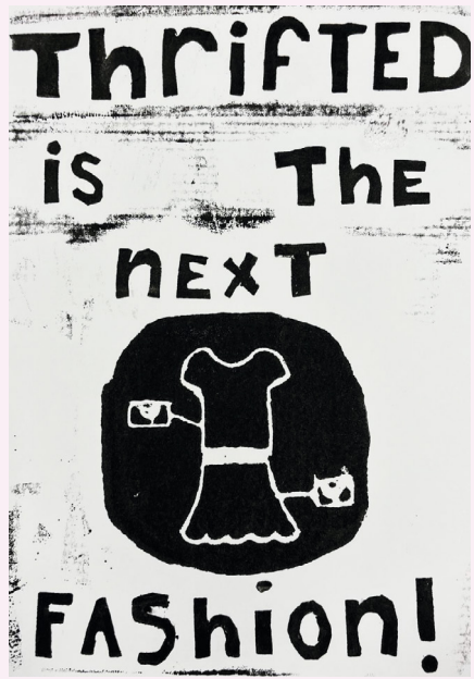
Posterprintles Kompas Op Groen