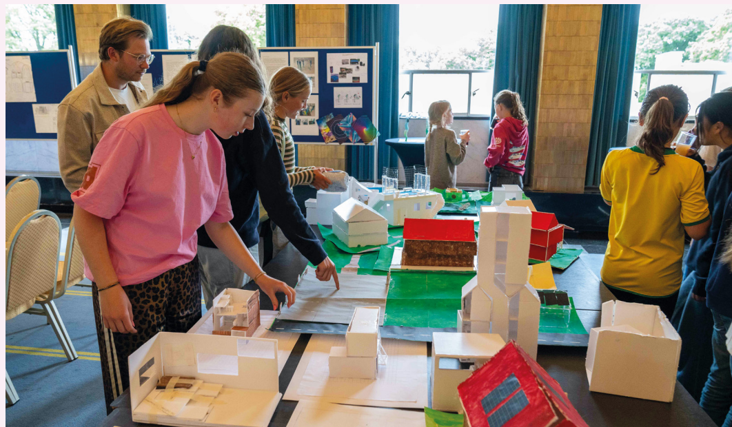
Toekomstlab Hilversum voor het voortgezet onderwijs