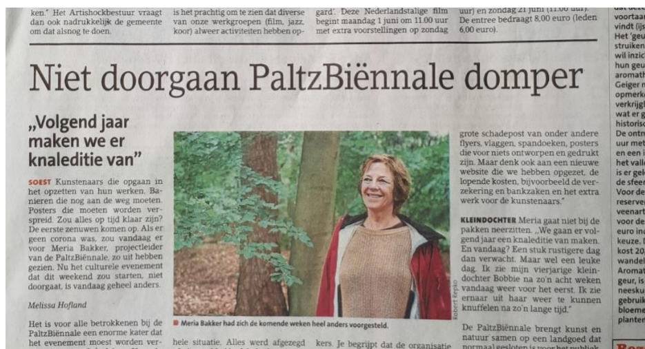
De PaltzBiënnale werd uitgesteld artikel Soester Courant 2020

In deze weken hebben vertegenwoordigers van het Mondriaanfonds, het KF Heinfonds én B&W van Soest een rondleiding gekregen. Voor de PaltzBiënnale 2022 gaan we geen evenementenvergunning bij de gemeente aanvragen omdat de tentoonstelling van de PB aantoonbaar geen evenement is. Wel moeten we in geval van een opening, een lezing o.i.d. de gemeente op de hoogte brengen van het plaats vinden van een 'klein evenement'.