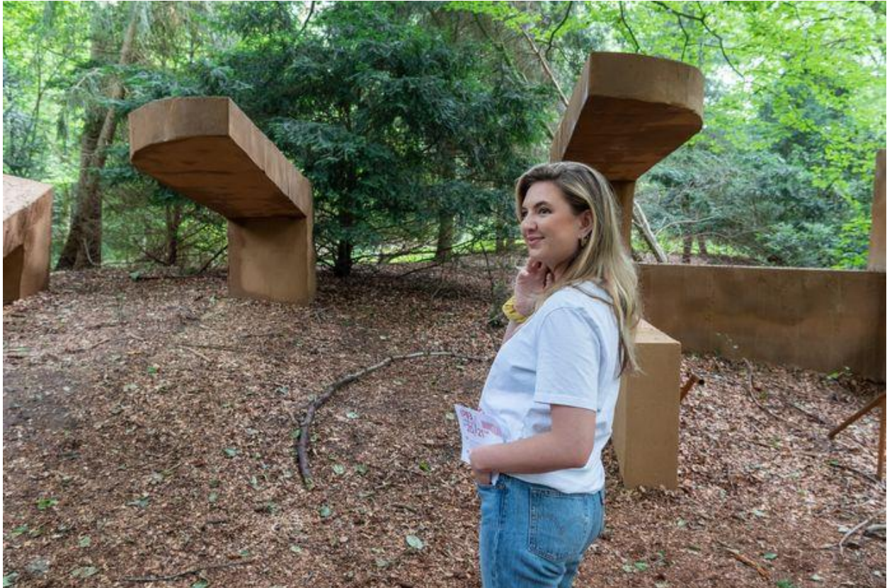
Kunststudente poseert bij Half Past History van Kevin Bauer

Bijzondere kunstexpositie op landgoed in Soest: ‘Het is een gekke combi van recreatie en een museum’