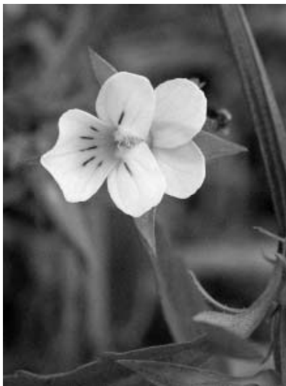
Schone akkers ten koste van het schone akkerviooltje.

De werkgroep zette zich direct af tegen het gebruik van de naam 'Engpark' zoals de gemeente de Zuidereng aanduidde in de formulering van de opdracht. Voor de Zuidereng geeft de werkgroep een gedetailleerde beschrijving van een akkerbeheer dat gericht is op herstel van de akkerflora. De vier deelgebieden – van Lazarusberg tot Zuidereng –