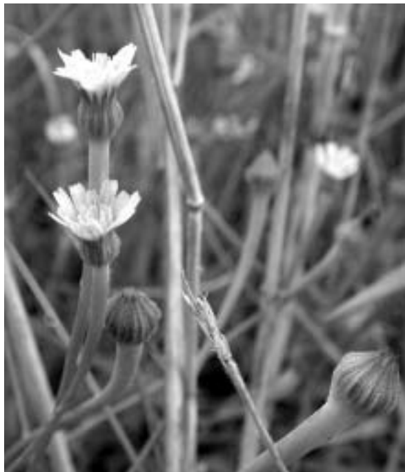
Afb. 3: Korensla, dat naast korenbloem en akkerviooltje niet terugkeert door het gebruik van geschoonde landbouwzaden.

Onder gunstig gesternte kon de werkgroep Soester Eng in 1980 worden ingesteld. Het werd zelfs een gemengde commissie die bestond uit vier ambtenaren en vijf burgers.