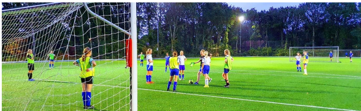
De trainingen zijn weer begonnen...

Dit jaarverslag is door het korte seizoen dit keer beknopter dan gewoonlijk. Zoals het er nu uitziet gaan we langzaam weer terug naar normaal en kunnen de competities voor iedereen weer starten. Wij hebben er in ieder geval zin in.