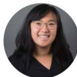
A-Yi Kah Vrijwilligersmakelaar Vrijwillige hulp thuis