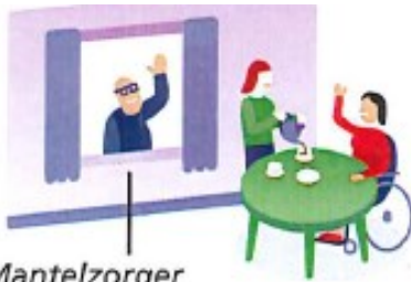
Mantelzorg kan er even uit

Een vrijwilliger aan huis gratis of bijdrage per keer Voor enkele uren per keer