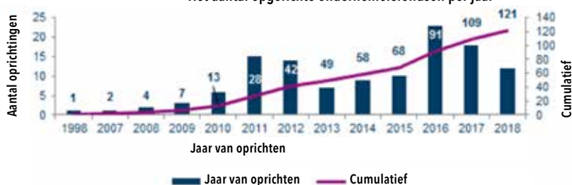
Het aantal opgerichte ondernemersfondsen per jaar

Ondernemersfondsen worden vaak opgericht met één of meerdere specifieke doelen. Gekeken naar de doelen van een ondernemersfonds valt enerzijds op dat er verschillen bestaan tussen vooral het doel van ondernemersfondsen op bedrijventerreinen, waar beveiliging een veelvoorkomend onderwerp is, en ondernemersfondsen in binnensteden en andere locaties. Hier is voornamelijk promotie en marketing van het gebied een vaak gesteld doel. Als vervolgens